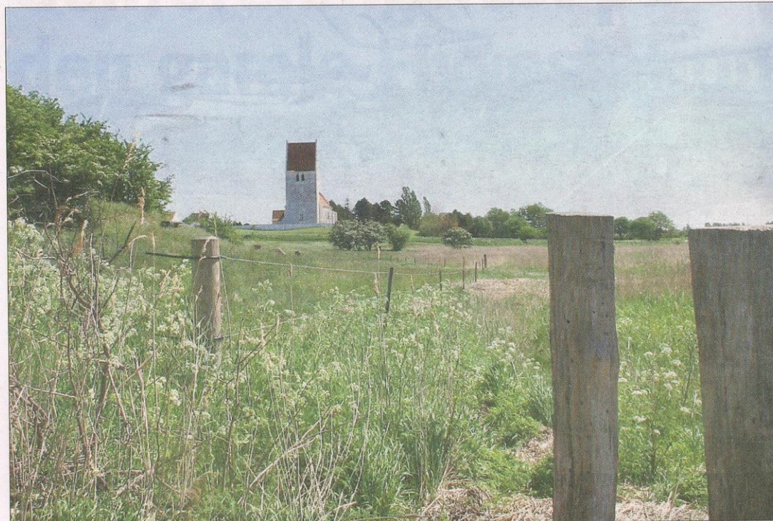
Fanefjord Kirke i det naturskønne Vestmøn er et punkt på cykelruten fra Glückstadt til Roskilde.

fra gennem Holstein til Femern. I Danmark fortsætter ruten i Rødby, går gennem otte kommuner og slutter i Roskilde. Cykelruten har et varieret forløb ad småveje og stier gennem landskabet. Undervejs passerer ruten kirker, klostre, historiske ruiner, hellige kilder, kulturmiljøer og naturområder.