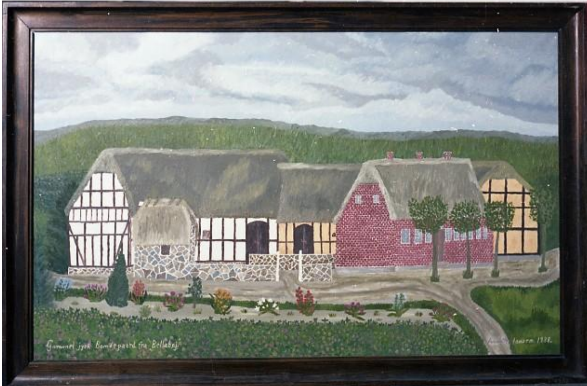
Jysk bondegård fra udstillingen ved Bellahøj 1938