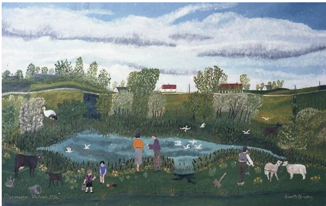
Ulvemosen 1936, liggende nær Ullemosevej i Lille Damme