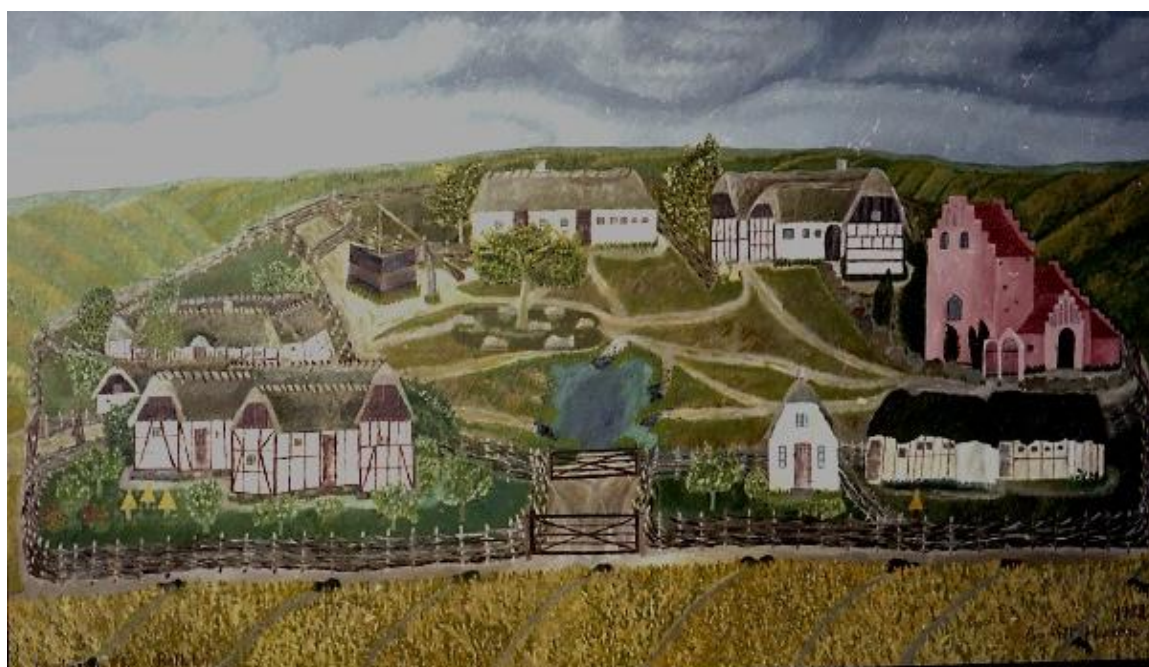
Fantasilandsby malet til Bellahøj 1938