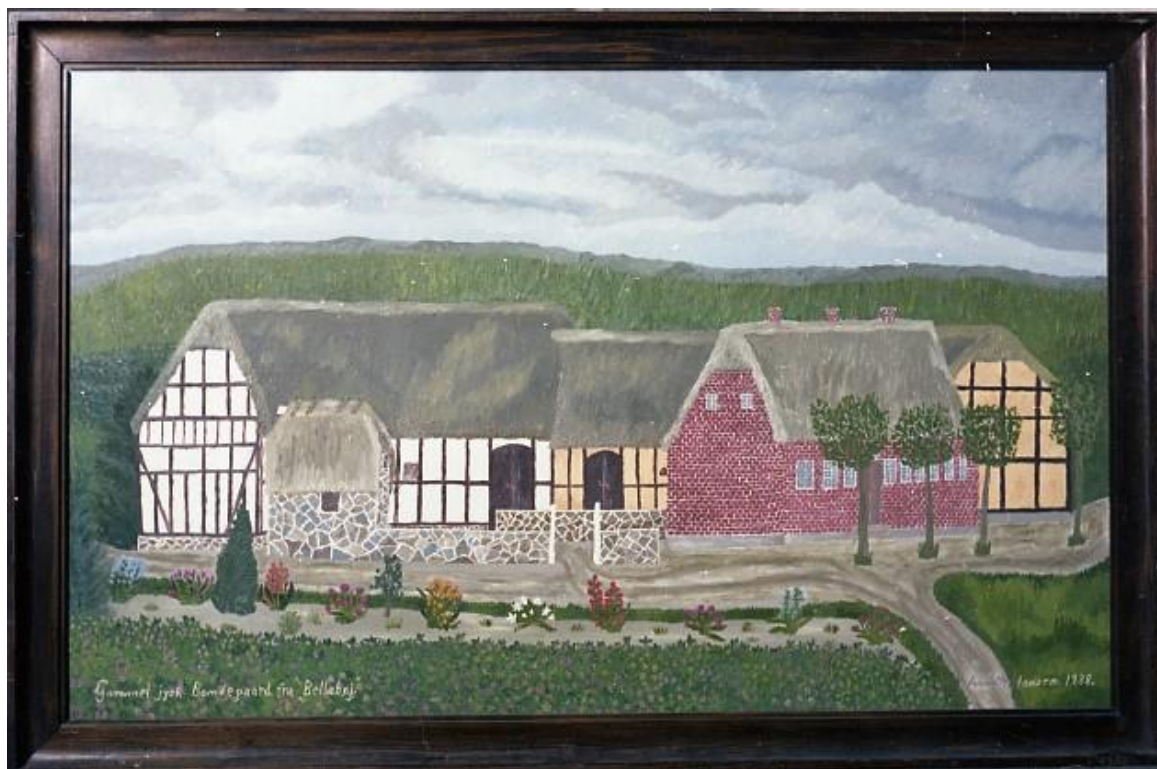
Jysk bondegård fra udstillingen ved Bellahøj 1938