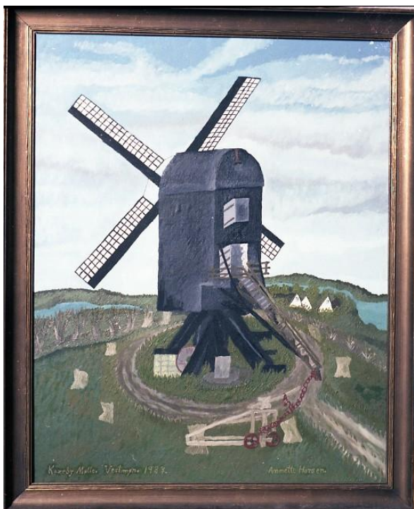
Kokseby Mølle 1938