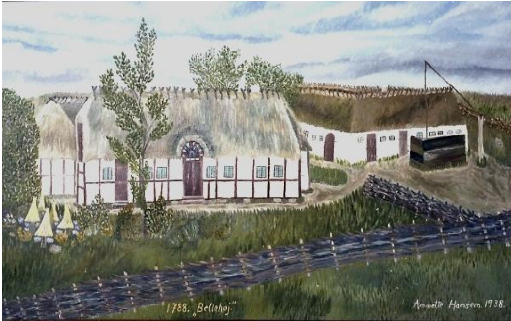
1788 Bellahøj, malet i 1938