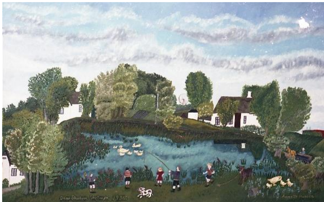
Dame Skovhøve 1936