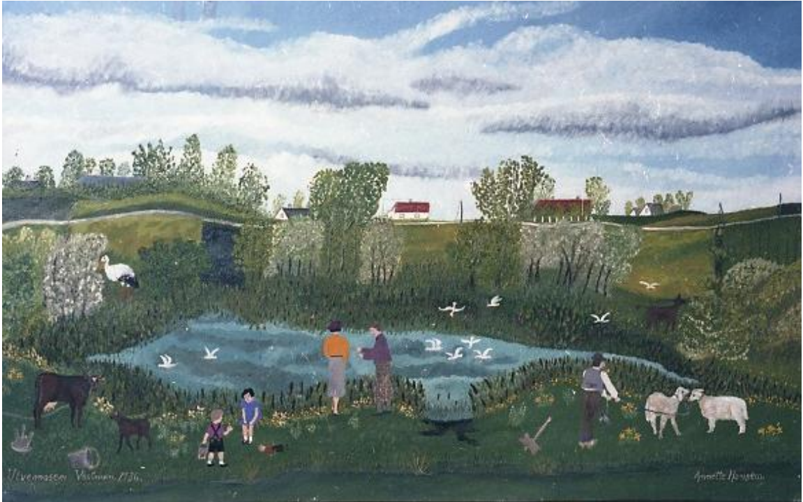
Ulvemosen 1936, liggende nær Ullemosevej i Lille Damme