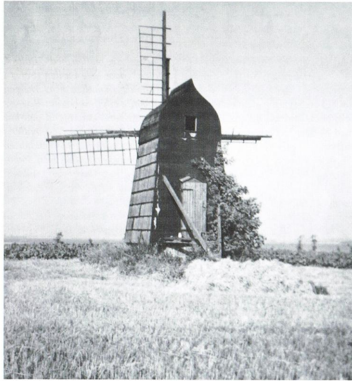
Møllen er så småt ved at gå i forfald. Billedet er fra engang i 1950-erne.

Møllen er privatejet, og for at sikre de investerede penge, er møllen underlagt en bevaringsdeklaration, som ejeren har underskrevet, og som efterfølgende blev tinglyst.