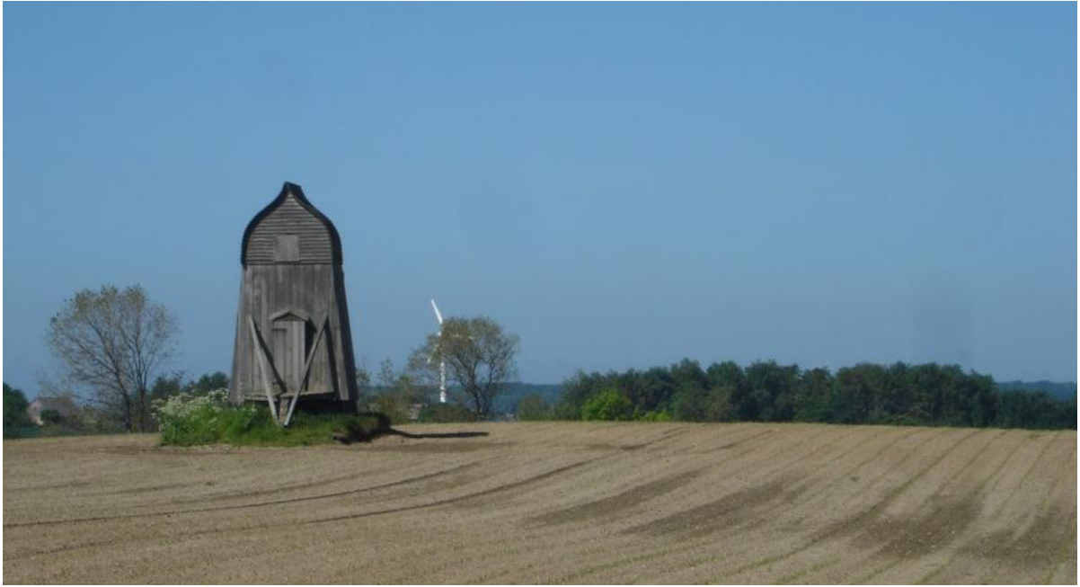
Stenøgård Mølle juni 2010