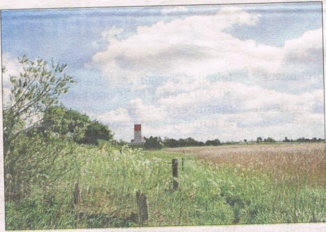
Et kikk fra naturstien ved Fanebjerg.