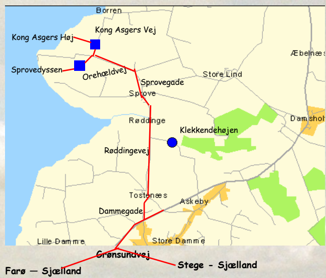
Kong Asgers Høj Kong Asgers Vej, 4792 Askeby