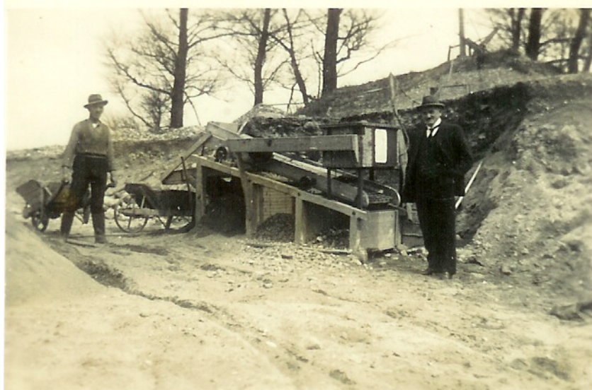
Sorterværk o. 1935

Der er gået mange sten igennem dette sortererværk, de kan også fortælle en historie, rejsen i den baltiske istid til Danmark, ligget i dvale i tusinder af år, for i vor tid at blive gravet op og brugt til vejmateriale.