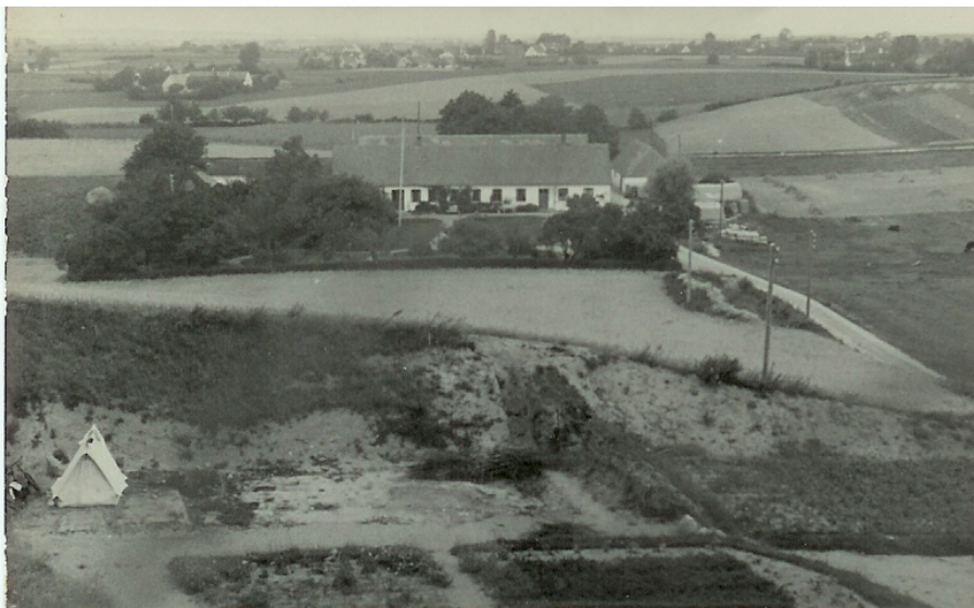
Tyskerne havde under 2. Verdenskrig 1940-45 en udkigspost på bakken og boede i barakker nedenfor bakken!