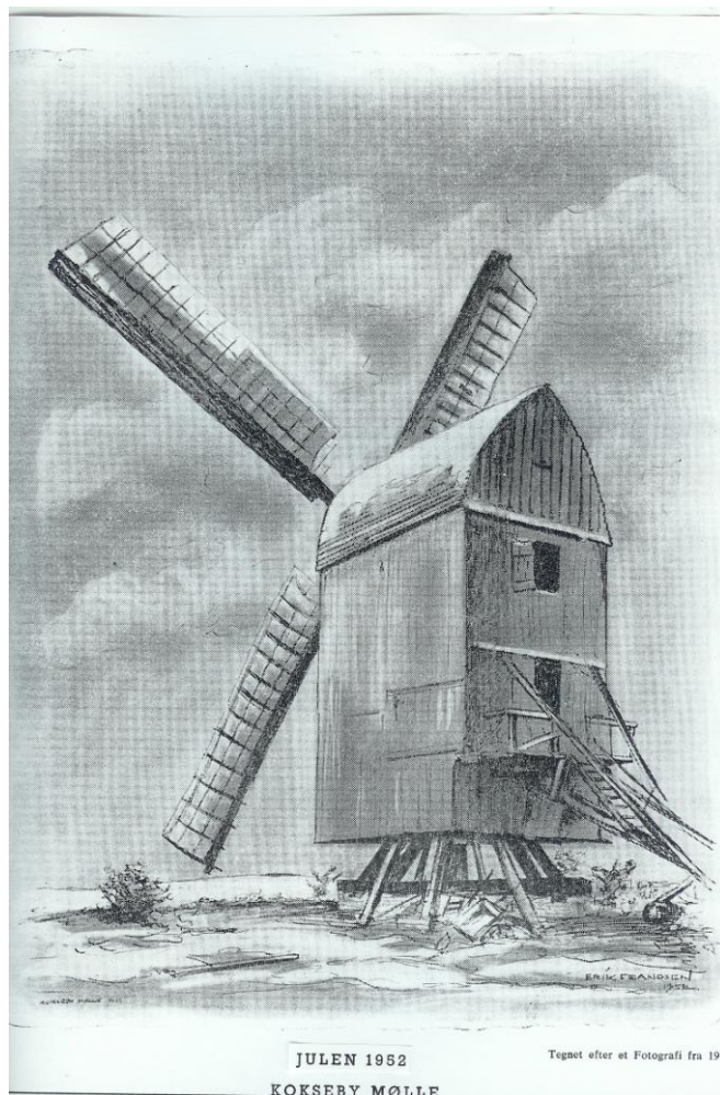
Fra Møns Folkeblad 1952, tegning af Erik Frandsen, Stege efter et fotografi fra 1913