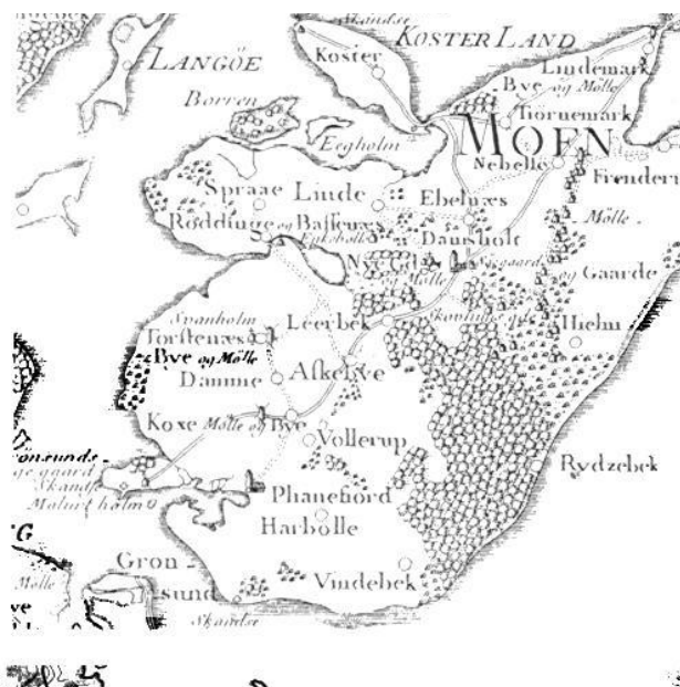
Videnskabernes Selskabs kort, 1776.