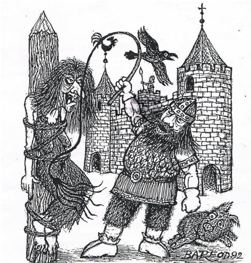
Ridder Troels på Kokseby Slot, blev spået af en heks, at han skulle dræbe sine egne sønner!!!

"Ikke vil vi være tre røveres viv! Langt heller vil vi miste vort unge liv!"