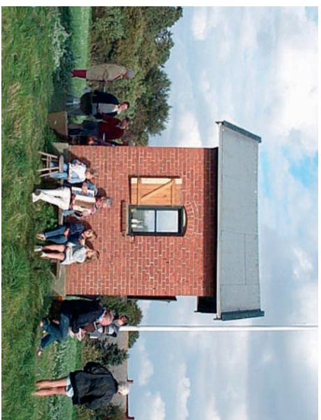
“Møllestangen” på Nyord som foreningen ejer, dannede i 2002 ramme om et hyggeligt arrangement med musik og sild.

Påføring af en ny overfladebehandling vil blot medføre at denne efterhånden skal vedligeholdes. Desuden tjener den kun til at sløre de fine detaljer der ofte findes i den blankt murede facade, som murede stik over vinduer og døre.