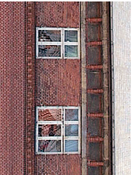
Fint murværk med mange detaljer bør bevares.

I de sidste 150 år er der på Møn bygget en del huse i murværk- uden puds.