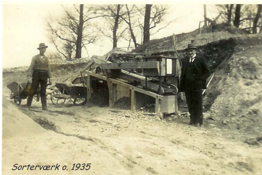
Sorterværk o. 1935

Der er gået mange sten igennem dette sortererværk, de kan også fortælle en historie, rejsen i den baltiske istid til Danmark, ligget i dvale i tusinder af år, for i vor tid at blive gravet op og brugt til vejmateriale.