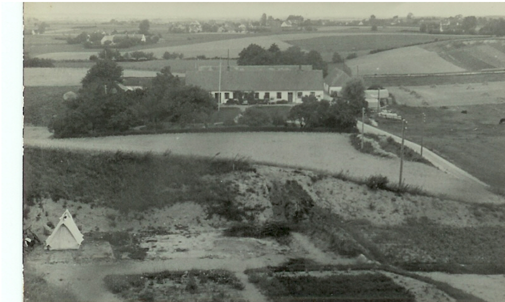
Tyskerne havde under 2. Verdenskrig 1940-45 en udkigspost på bakken og boede i barakker nedenfor bakken!