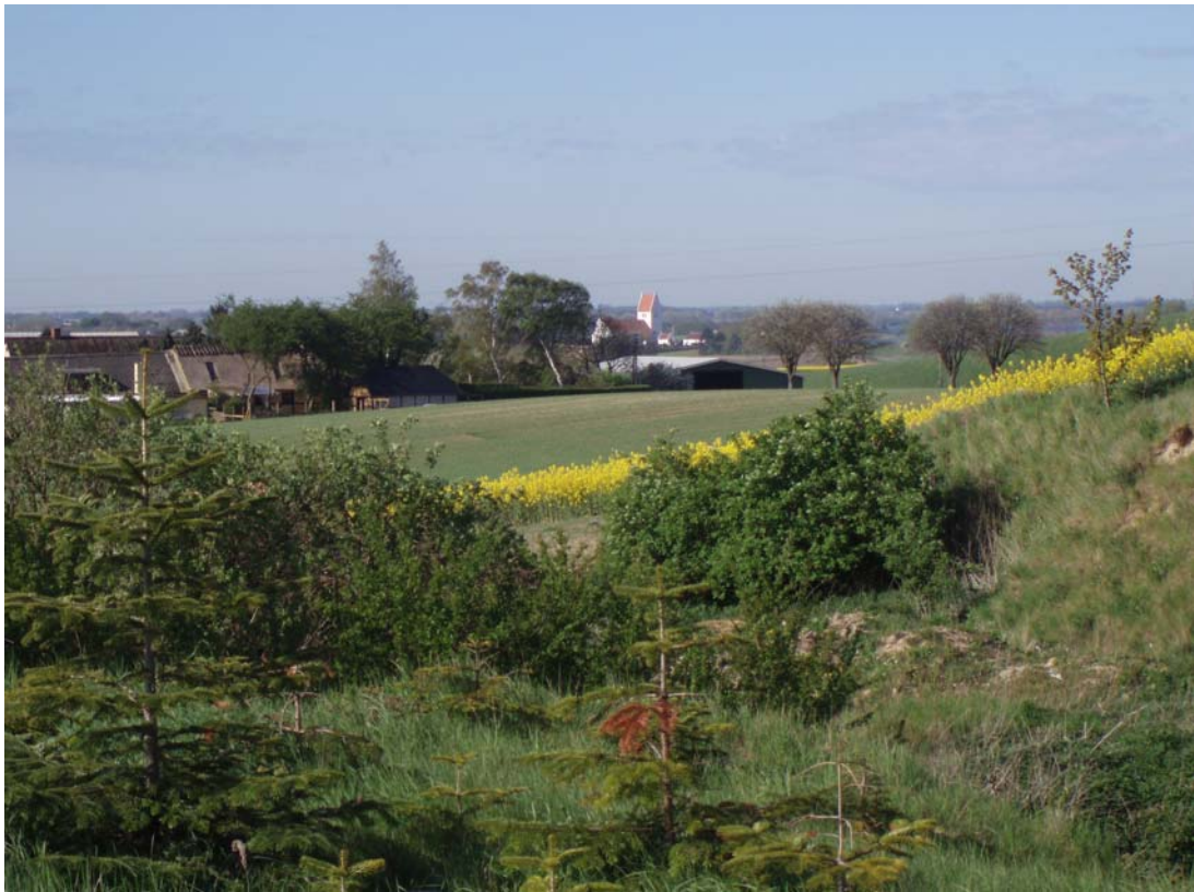
Præstbjerg Grusgrav sommer 2007